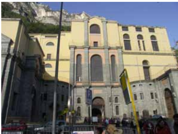
Pogled na črpalno postajo Riva del Garda