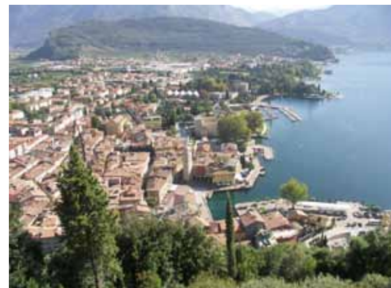
Pogled na Riva del Gardo