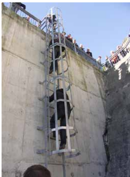
Dostop v spodnji del pregrade