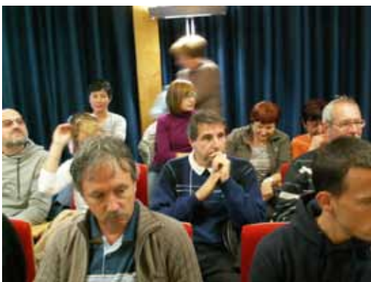
Instituto Agrario di San Michelle all'Adige - predavanje