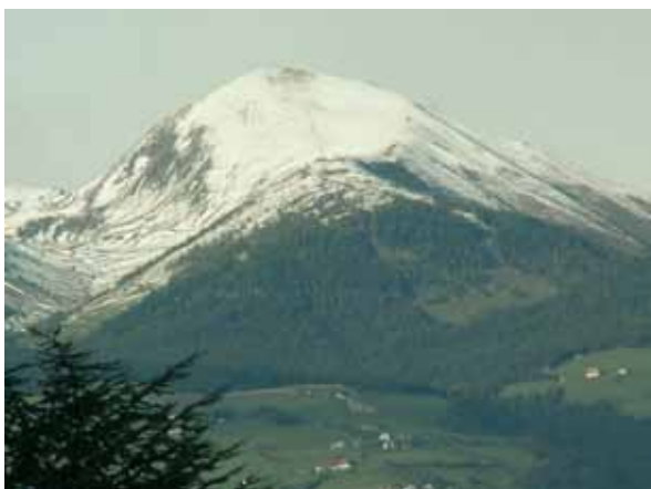
Zasneženi vrhovi naznanjajo zimo