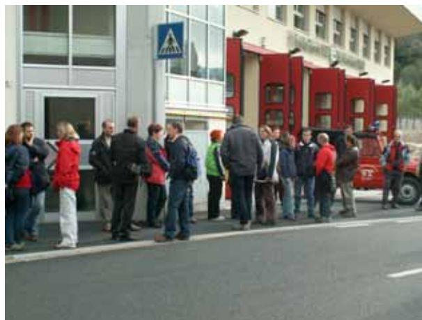
Čakajoč na avtobus