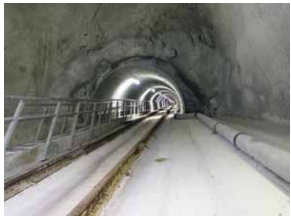
V črpalni postaji Riva del Garda