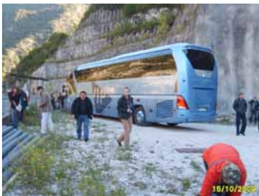
Prihod k pregradi