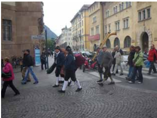
Pred arheološkim muzejem