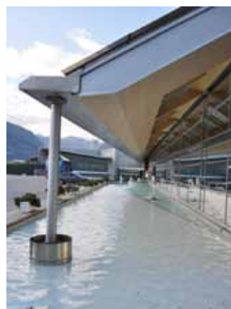
Še ena od zunaj