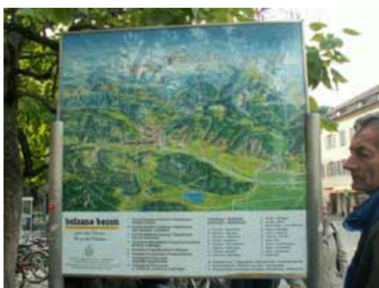
Bolzano – karta mesta