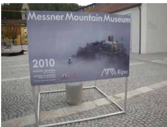
Postanek v Brunicu