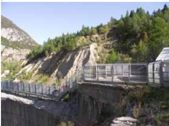
Dostop na levi bok pregrade