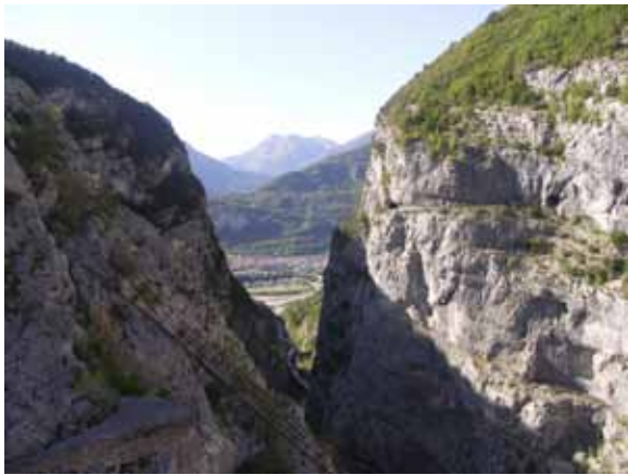
Pogled proti mestecu Longarone