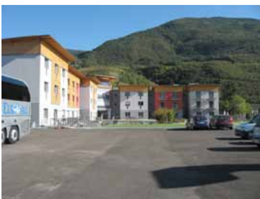
Instituto Agrario di San Michelle all'Adige