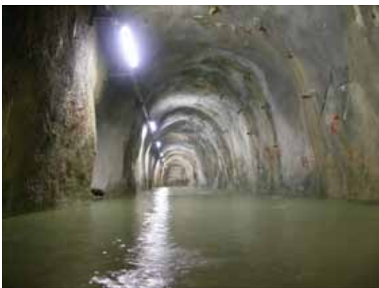
Galerije za odvodnjavanje bokov pregrade