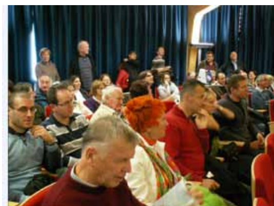
Instituto Agrario di San Michelle all'Adige - predavanje