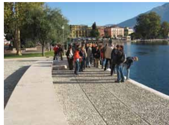
Pred črpalno HE