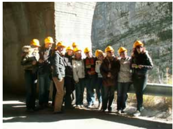
Gasilska slika spodaj