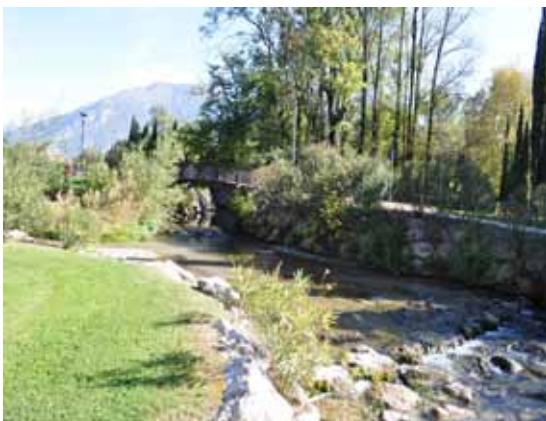
Utrinki iz Riva del Garde – utrinki iz mesta