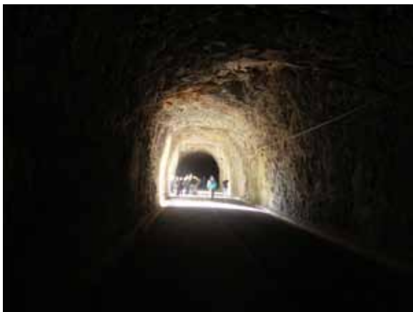
Dostop na spodnji del pregrade