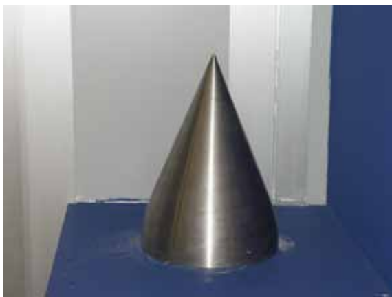
Nov iglasti zasun