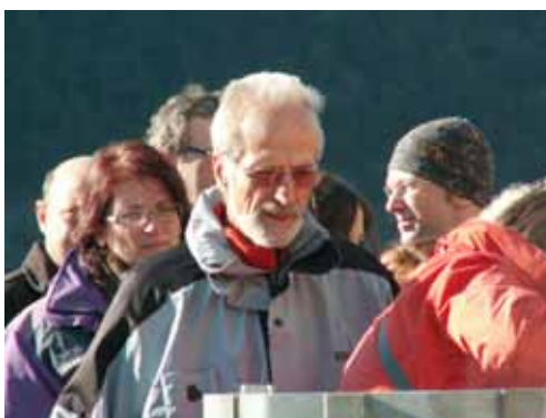
Dostop v spodnji del pregrade