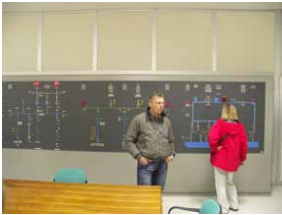
V komandnem delu