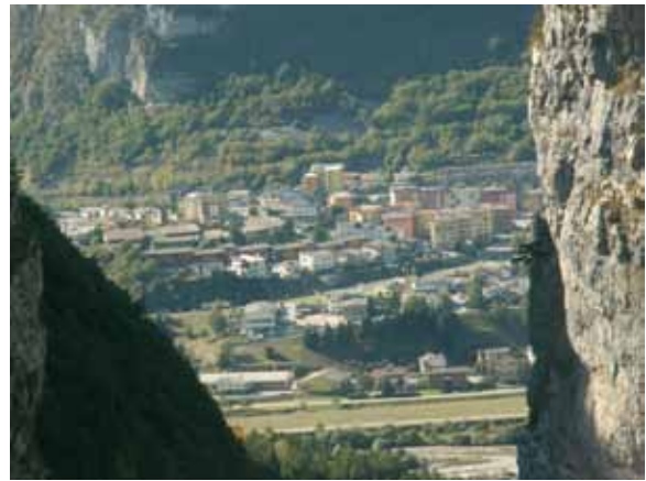
Pogled proti mestecu Longarone