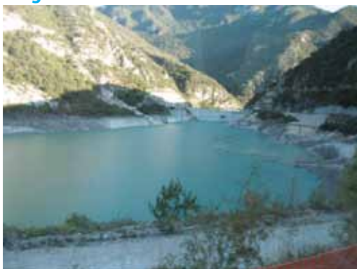
Pogled na pregrado