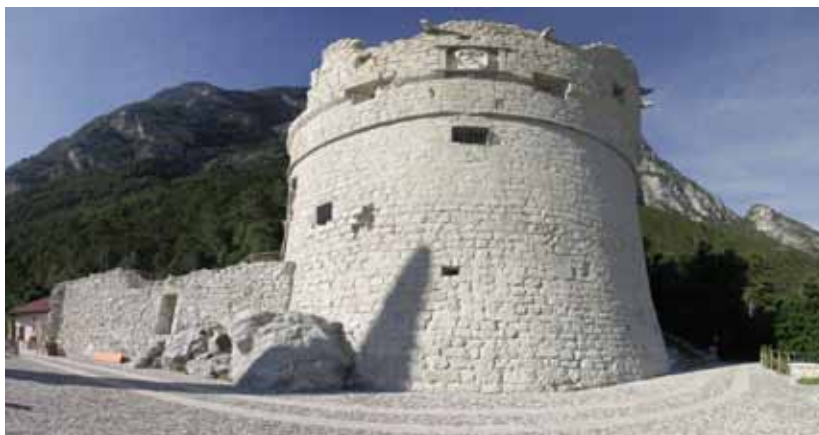
Pogled z obale z beneško Beneška trdnjava od blizu trdnjavo v ozadju