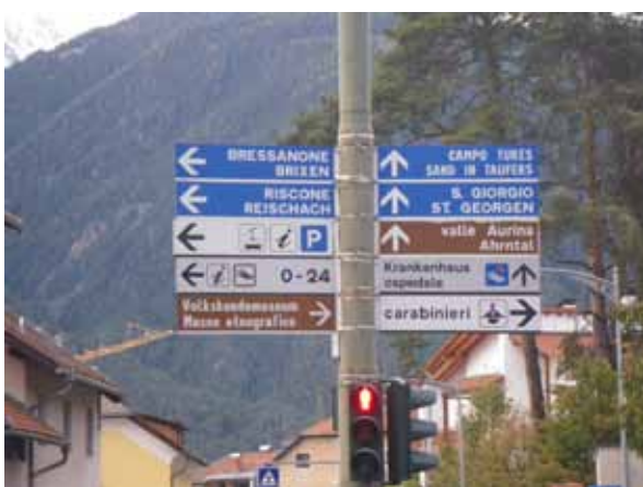
Pa gremo proti domu