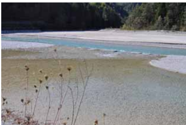
Počitek na poti proti Vajontu