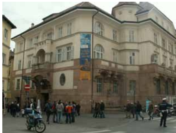
Pred arheološkim muzejem