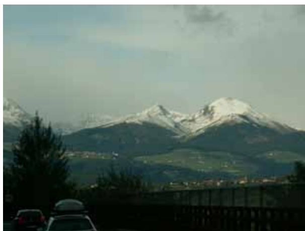
Zasneženi vrhovi naznanjajo zimo