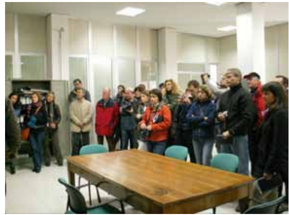
V komandnem delu