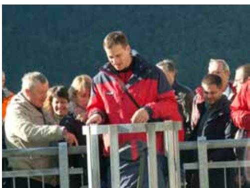
Dostop v spodnji del pregrade