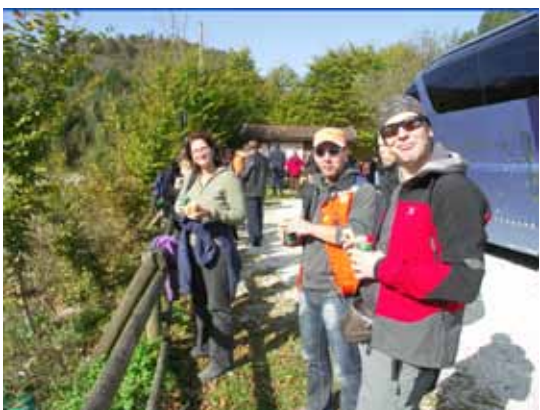
Počitek na poti proti Vajontu