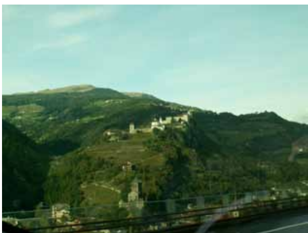
Proti severu domov