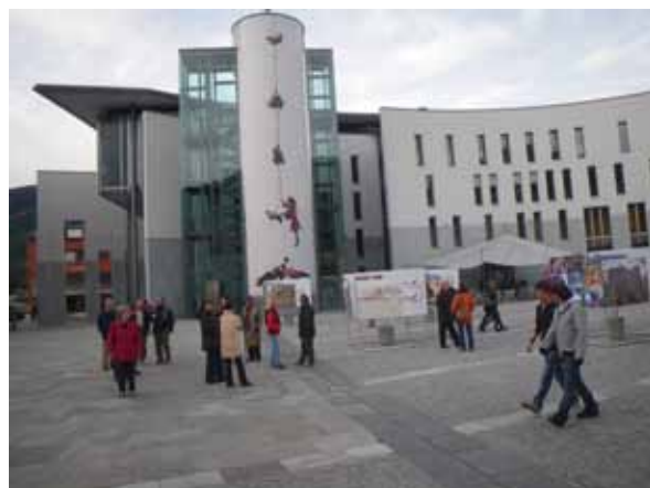
Postanek v Brunicu