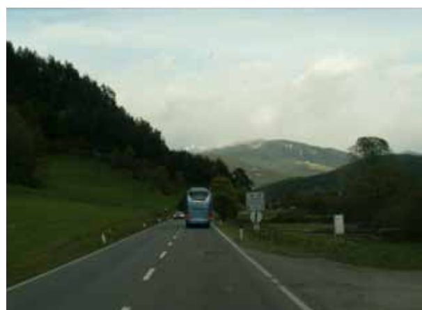
Pa gremo proti domu