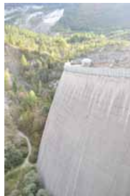
Pogled na pregrado Vajont