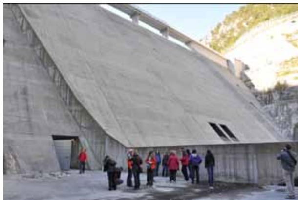
Na spodnjem delu pregrade