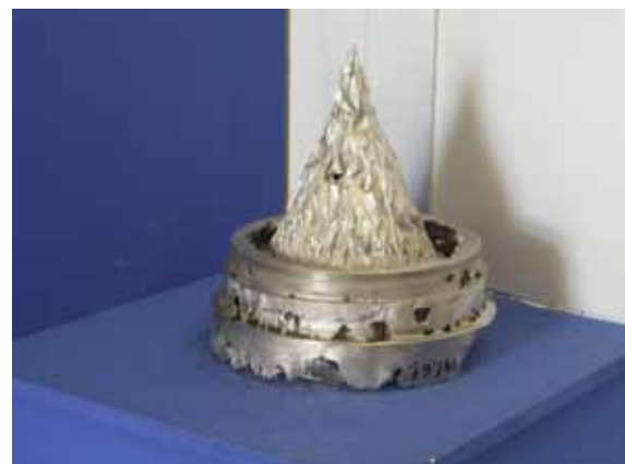
Iglasti zasun po abraziji s peskom v vodi