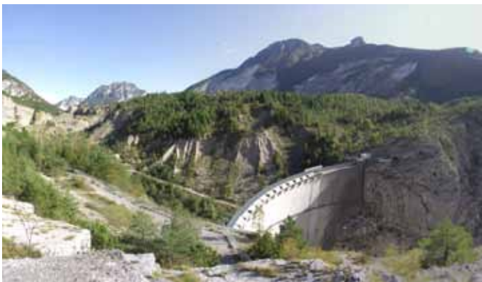
Pogled na pregrado Vajont in plaz, ki je zgrmel v akumulacijski prostor