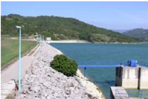
Akumulacija Botonega; avtor Tomaž Umek