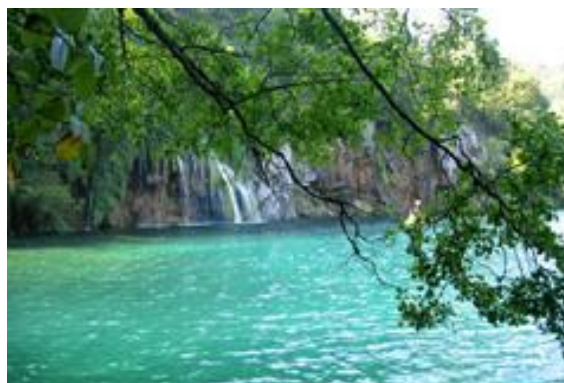
Plitvička jezera