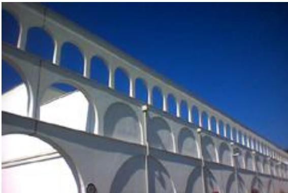
ČN Botonega; avtor Jože Crnič