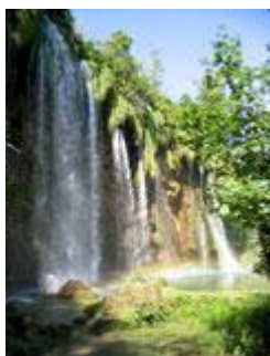
Plitvička jezera; avtor Borut Roškar