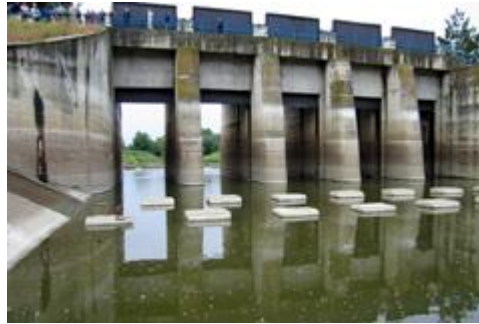
Lonjsko polje, zapornica Trebež; avtor Zdenko Zupančič