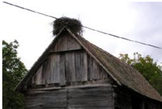
Lonjsko polje; avtor Tomaž Umek