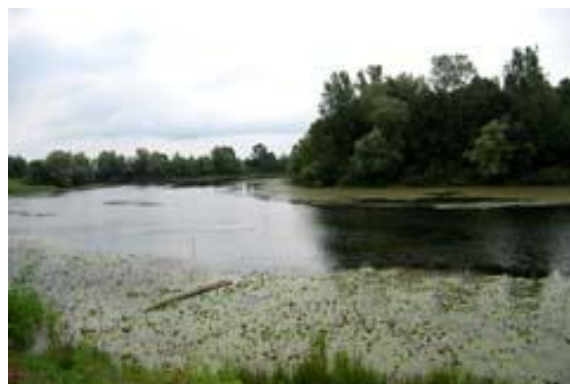
Lonjsko polje; avtor Petra Kralj