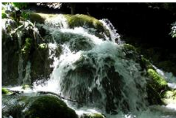
Plitvička jezera