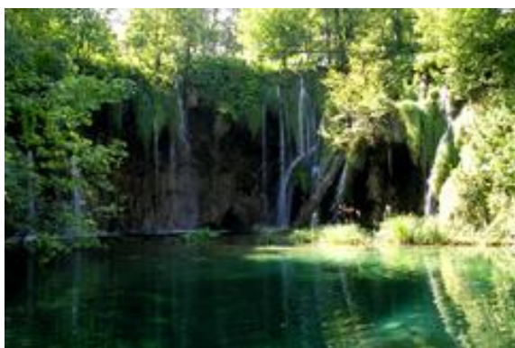
Plitvička jezera