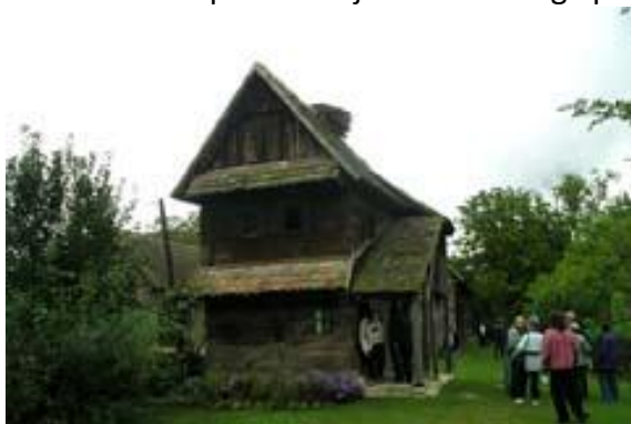
Lonjsko polje, Čigoč

Turistični izlet po območju Nacionalnega parka.