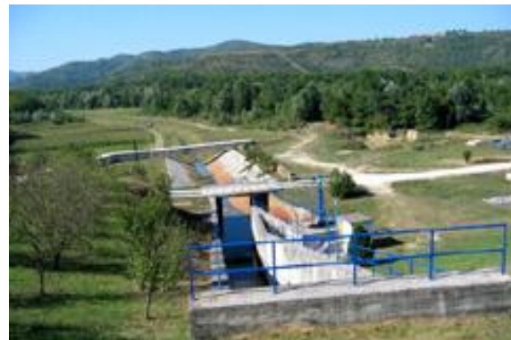
Akumulacija Botonega; avtor Petra Kraj