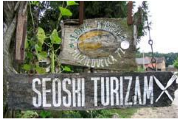
Lonjsko polje, Mužilovčica