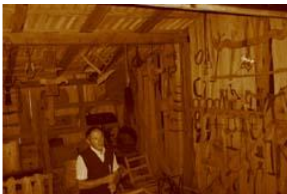
Lonjsko polje, Čigoč