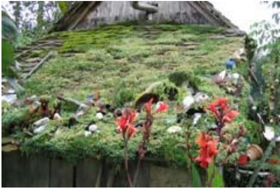
Lonjsko polje