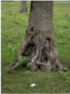
Lonjsko polje; avtor Tomaž Oberžan